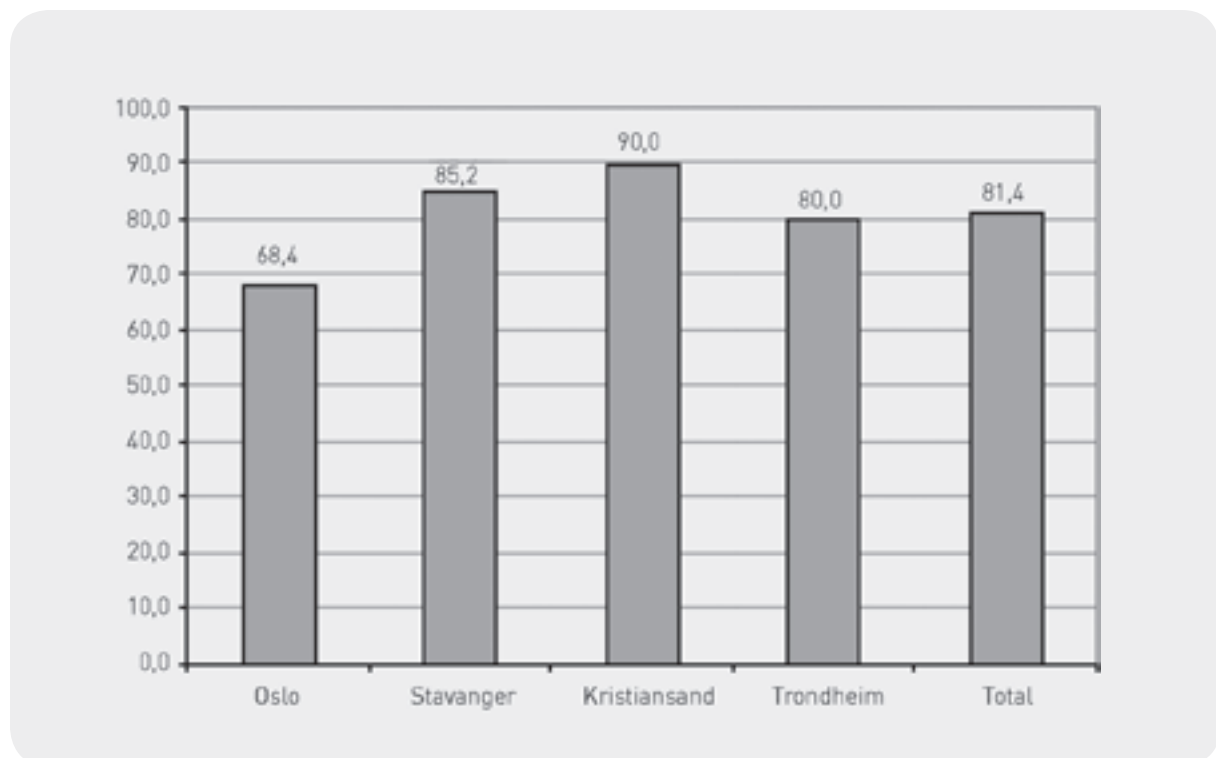
Figur 9.1 Andel som mener at Oppfølgingsteam har nådd målgruppen, fordelt i forhold til prosjektkommunene (prosent).

På spørsmålet om Oppfølgingsteam har vært godt organisatorisk forankret, er det derimot forskjeller mellom prosjektkommunene. Samarbeidsaktørene i Kristiansand mener i signifikant høyere grad enn samarbeidsaktørene i Oslo og Stavanger at prosjektet har vært godt organisatorisk forankret (ANOVA, F-verdi=7.40, df=78, p<.001). Imidlertid mener samtlige samarbeidsaktører i alle fire prosjektkommuner "I stor grad" til "I svært stor grad" at Oppfølgingsteam bør videreføres etter endt forsøksperiode.